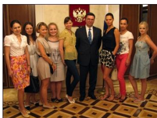
Lecture of Aleksandr A. Pankin, First deputy, Permanent Mission of the Russian Federation to the UN

Также для слушателей были организованы визиты в ООН, Федеральный Резервный Банк Нью-Йорка, Блумберг, Нью-Йоркскую Фондовую Биржу, Мэрию Нью-Йорка, Посольство РФ в Вашингтоне, Сенат США и Белый Дом.