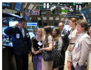
Visit to the New York Stock Exchange