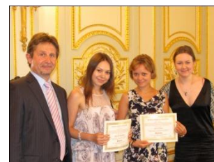
Diploma Ceremonies at the Consulate General of the Russian Federation