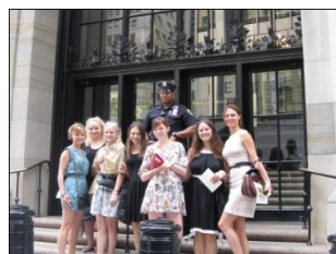
Visit to the Federal Reserve Bank NY